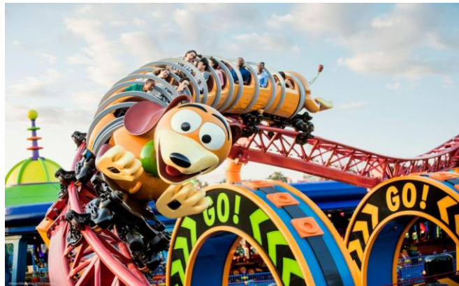
ディズニー・ハリウッド・スタジオ