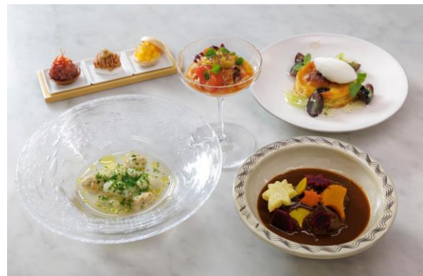
車内で提供されるコース料理