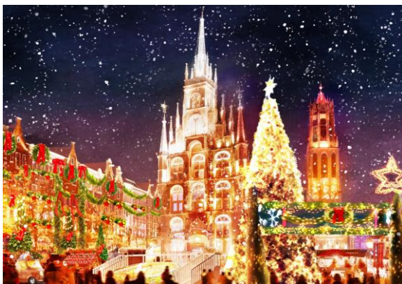
ハウステンボス クリスマスマーケット（12月）