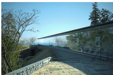
小田原文化財団 江之浦測候所