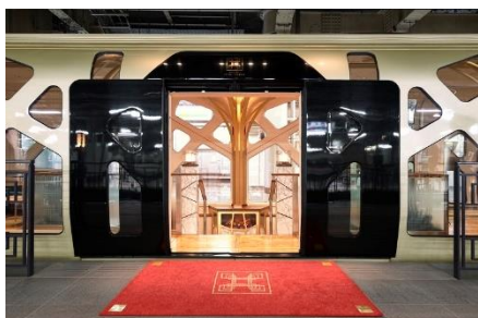
上野駅 13.5 番線

3日目最終日の旅の始まりは海が見える駅として人気の根府川駅にて日の出をご自由にお楽しみいただけます。小田原では「報徳会館 食楽庵 報徳」での和会席の朝食の後、隣接する「報徳二宮神社」を散策・参拝いただけます。その後、小田原文化財団 江之浦測候所へご案内します。上野駅到着後、専用ラウンジ「プロローグ四季島」にて旅の思い出やご感想を語らうフェアウェルパーティーを行います。