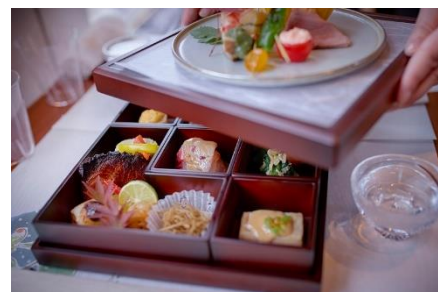
2日目の昼食「神楽坂くろす」