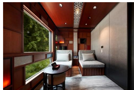
客室の一例「スイート」