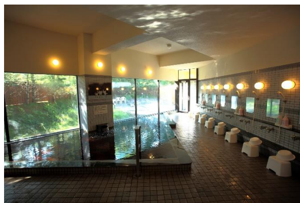
立ち寄り温泉の一例