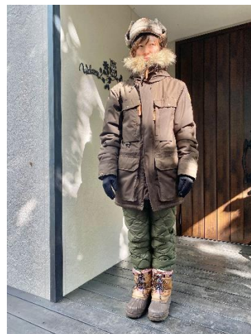
レンタル品着用イメージ