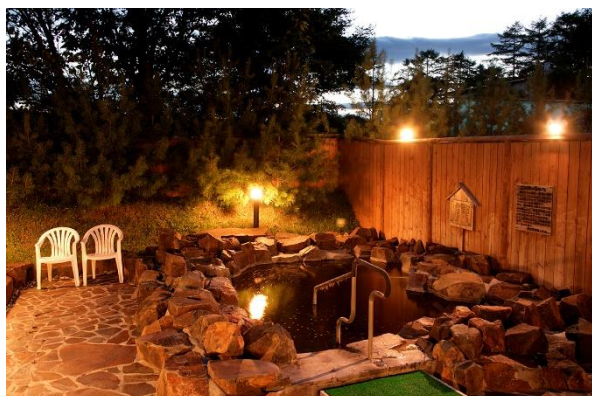
立ち寄り温泉の一例