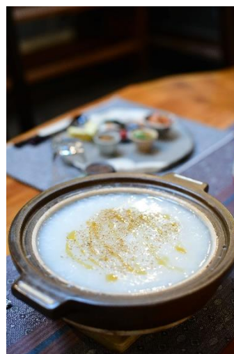
道産米ななつぼしのオリジナルのお粥