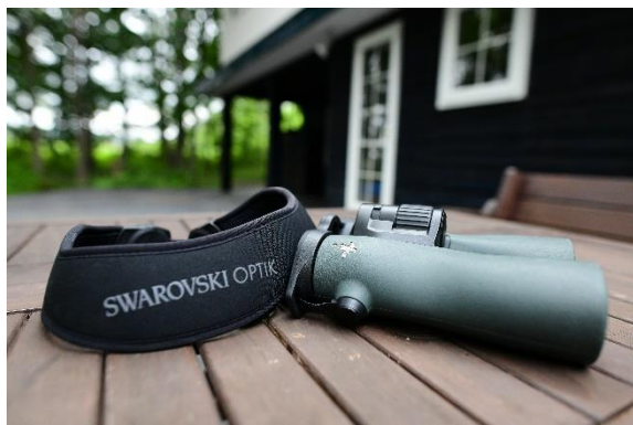
スワロフスキー双眼鏡