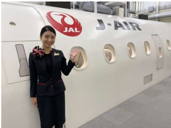
モックアップ（イメージ）＊当日の客室乗務員とは異なります

また普段なかなか入れない J-AIR の訓練施設へ特別にご案内いたします。モックアップでの客室乗務員のサービス訓練体験や模擬コックピットではパイロットと一緒に模擬操縦体験を実施します。その他も大人も子どもも楽しめる体験系プログラムをご用意しております。