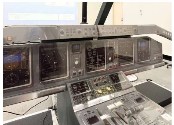
模擬コックピット（イメージ）