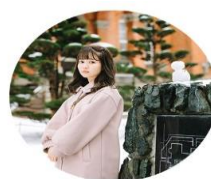
北海道庁旧本庁舎 & 赤レンガテラス