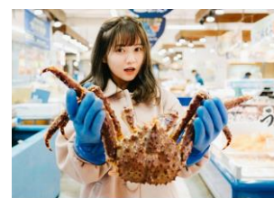
フォトブック掲載写真一例