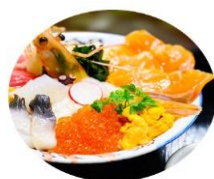
海鮮食堂 北のグルメ亭「海鮮 丼」