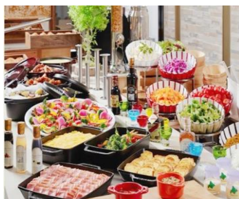
北海道の食材を使った人気の朝食