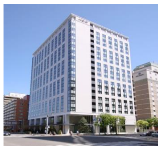
2019年5月オープン 札幌駅北口から徒歩3分と便利