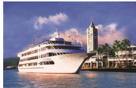
バリアフリー対応クルーズをご用意