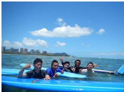
2名の現地トレーナーが体験をサポート