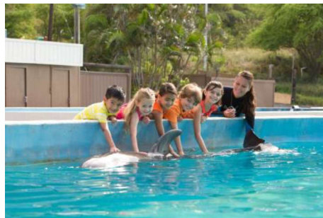
イルカと触れ合えるドルフィンアロハ